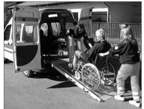
Automezzo attrezzato per il trasporto disabili