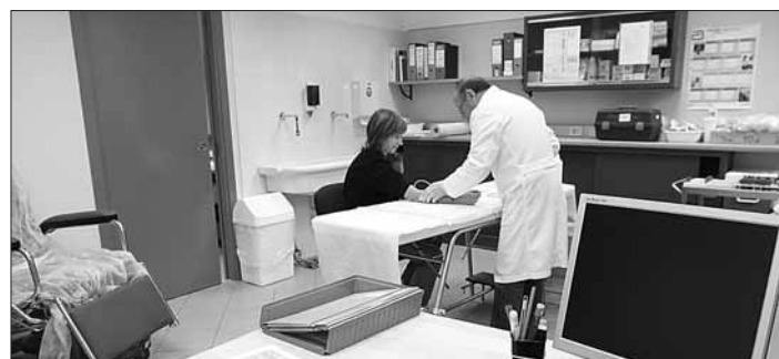
La sala prelievi