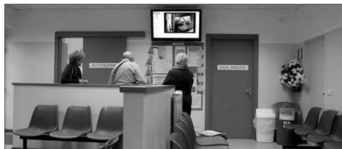
La sala d'attesa