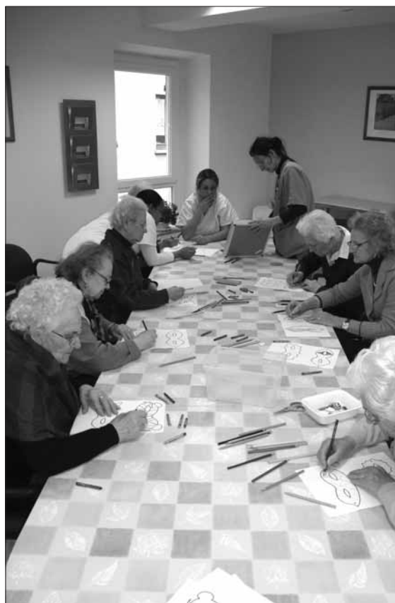
Il laboratorio creativo al centro diurno integrato

Il centro fornisce servizi legati alle esigenze quotidiane come l'aiuto nell'igiene e cura della persona, il pranzo e l'alimentazione, la somministrazione di farmaci, terapie e altre prestazioni sanitarie. Inoltre agli ospiti vengono proposte attività motorie, di riabilitazione e ricreative svolte in diversi laboratori e iniziative culturali.