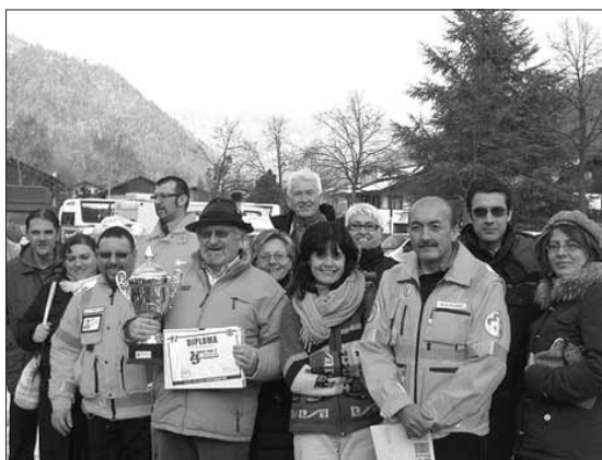
I volontari di SOS Malnate ai Campionati SCI di Pinzolo