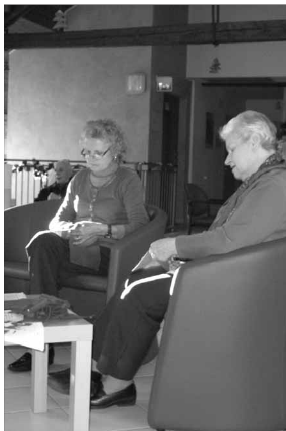
Il laboratorio di taglio e cucito

Per ulteriori informazioni contattare la Segreteria del Centro telefonando al seguente numero: 0332.426.002 dal lunedì al venerdì dalle 9 alle 12.