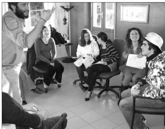
Un incontro tra i ragazzi di SOS Junior e gli educatori dell'Associazione Aquilone

SOS Malnate ha avviato una collaborazione con l'associazione Aquilone di Malnate per il progetto Radio Web. Il progetto Radio Web è un'opportunità per i ragazzi di SOS Junior di integrarsi nella vita dell'associazione, ma anche di socializzare con altri ragazzi e condividere i loro interessi. Attraverso la costruzione di una radio, i giovani potranno affrontare qualsiasi argomento, dal più scherzoso al più impegnato. Buon lavoro!