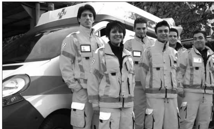
I volontari del servizio civile in SOS

La cosa più bella sono le persone conosciute, qui sono tutti simpatici e in associazione mi trovo molto bene.